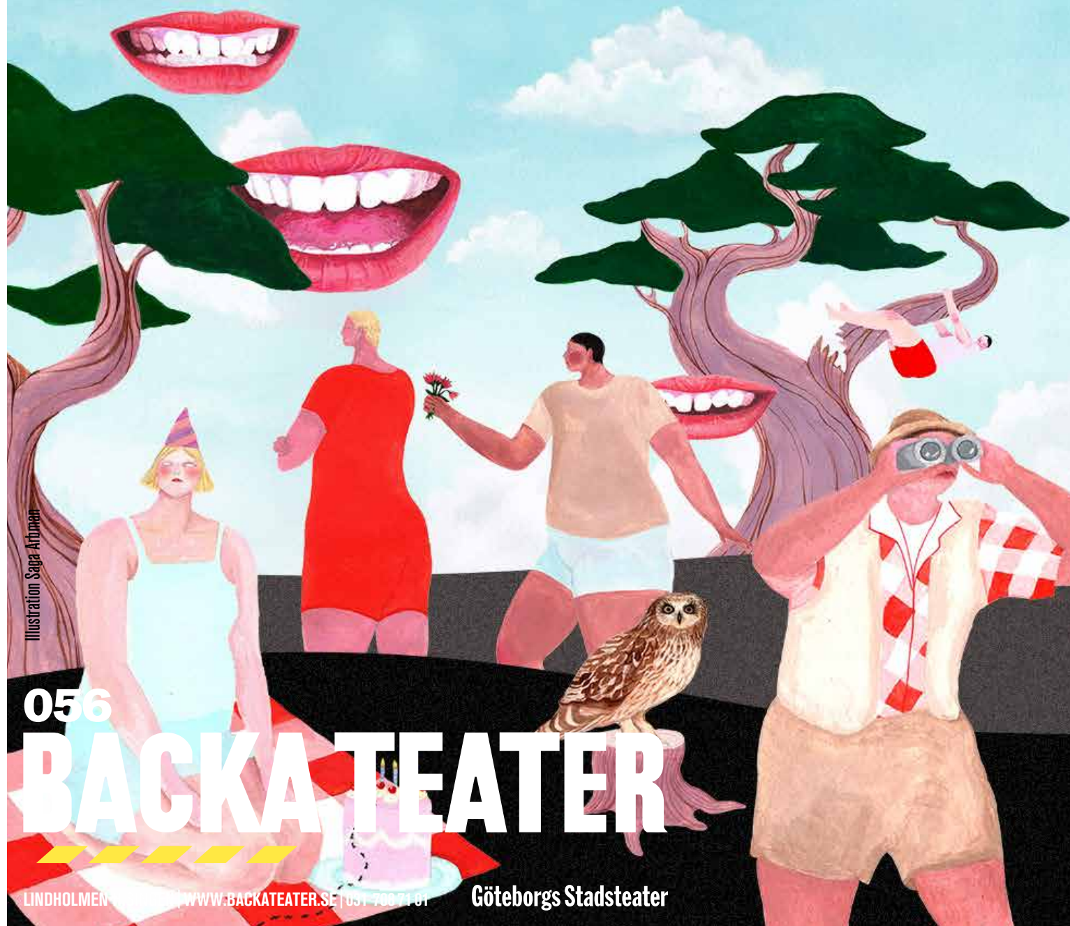
Illustration Saga Artman