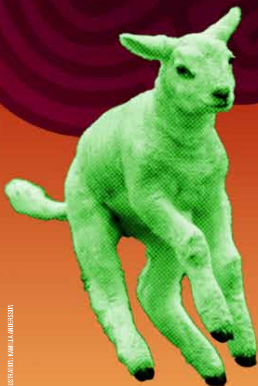
ILLUSTRATION: KAMILLA ANDERSSON