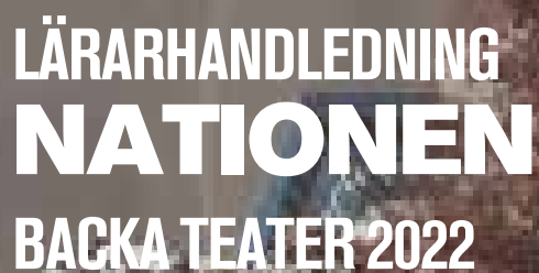
Illustration Kirsti Abrahamson