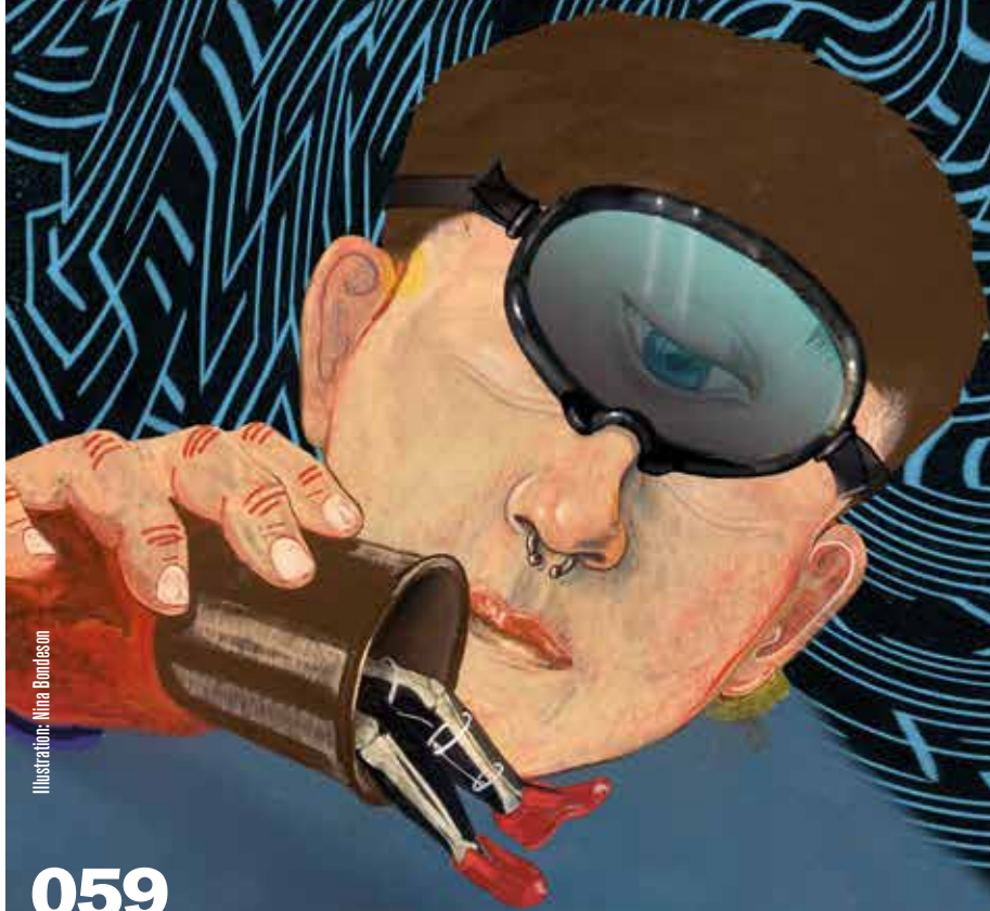
Illustration: Nina Bonfieson