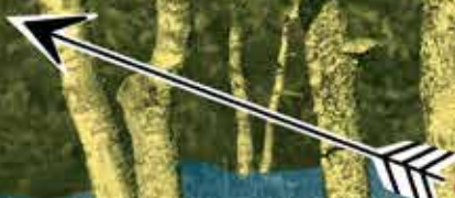
Illustration: Nina Bonfisson